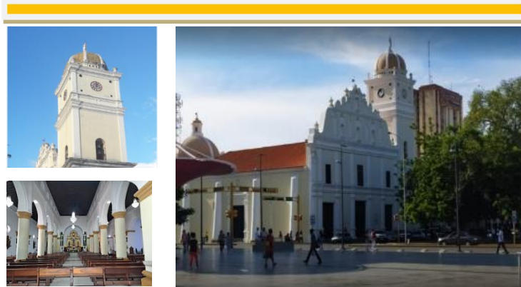
Figura 1. Catedral de San José

Este inmueble fue declarado Monumento Histórico Nacional mediante la Gaceta Nº 26.320 del 02 de Agosto de 1960, bajo la Presidencia de Rómulo Ernesto Betancourt Bello. A comienzos de los 80, el Ministerio del Desarrollo Urbano realizó una nueva intervención el techo fue cambiado en su totalidad, y los materiales existentes de la época que fueron sustituidos por tablas de madera y tejas. Con esta intervención cambió el diseño ya que las características que tenía del siglo XVIII fueron eliminadas, la Catedral lucía inmensamente fría y vacía ya que nunca fue retomado su diseño interior en cuanto a sus retablos y demás elementos decorativos.