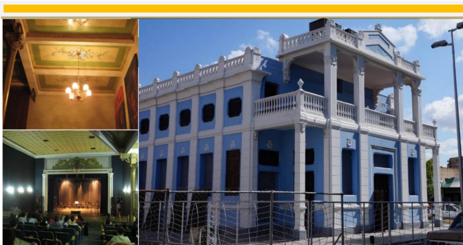
Figura 3. Teatro Ateneo de Maracay

El Ateneo estuvo cerrado desde la muerte de Gómez en 1935 hasta 1968 reactivado por grupos culturales de la región aragüeña. El edificio fue nuevamente cerrado por deterioro en 1989 y recuperado en 1995 bajo la protección de la Fundación Teatro Ateneo de Maracay. En el año 2015 se le hizo una restauración integral que le dio una nueva vida a este espacio de las artes, colocando este Monumento Histórico Nacional a la vanguardia del mundo artístico y escénico, que hoy vibra en el corazón de Maracay.