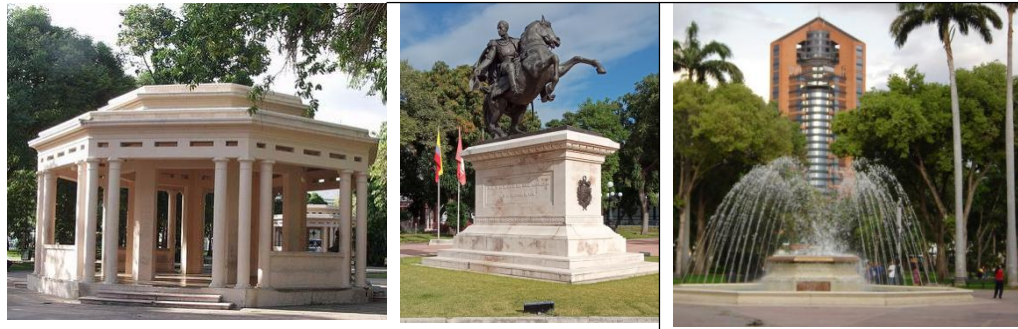
Figura 5. Plaza Bolívar de Maracay

Esta magnífica obra cuenta con una trayectoria amplia de modificaciones, fue declarada Monumento Histórico Nacional el 15 de abril de 1994, según Gaceta Oficial N° 35441. De acuerdo con el grupo MCI (2015) a finales del 2014 , se realizó una reinauguración de la plaza Bolívar “ con un imponente sistema de iluminación a cargo de Grupo MCI. La restauración integral de la plaza ha supuesto una inversión total de 162 millones 673 mil bolívares (23,5 millones de euros)” (p.1). Las modificaciones se centraron ms que todo en las glorietas y la fuente principal de al plaza , incorporando una iluminación dinámica.