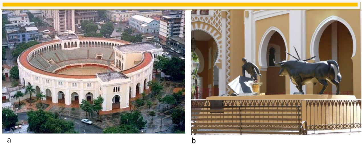
Figura 4. Maestranza “César Girón” (a) y La Girondina (b)